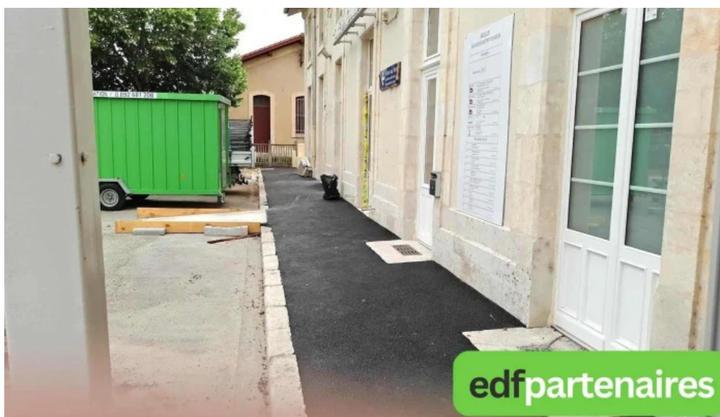
Boutique sncf aiguillon