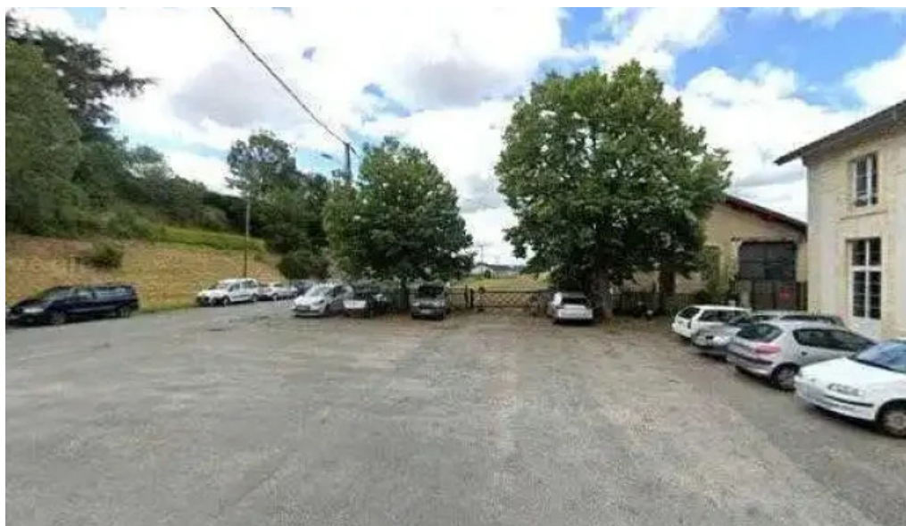
Boutique sncf street view et 360deg