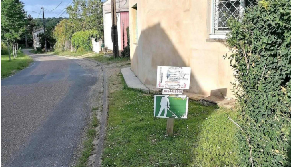
Claire couture 33 photos du propriétaire