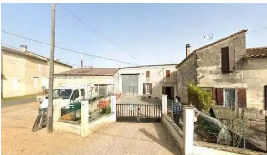
Claire couture 33 street view et 360deg