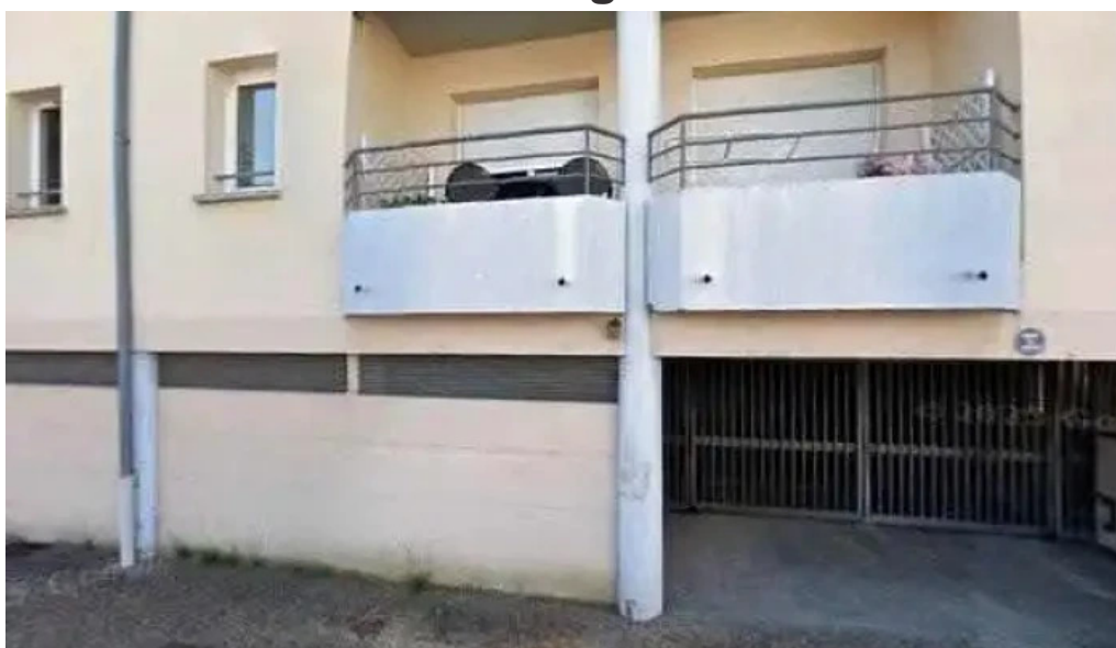
Boucherie du terroir tout