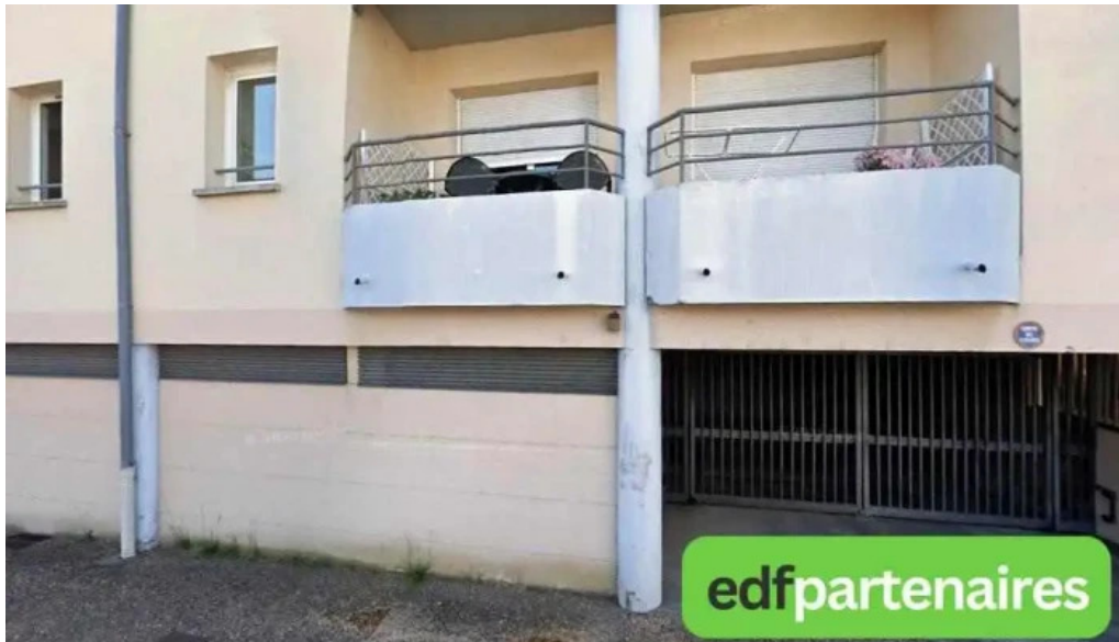
Boucherie du terroir abzac