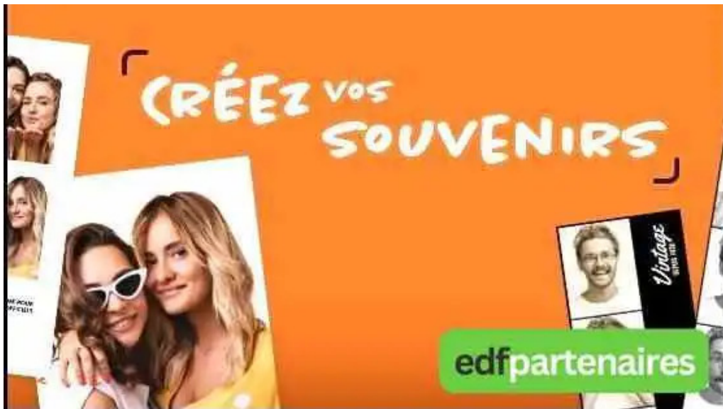
Photomaton photos du propriétaire