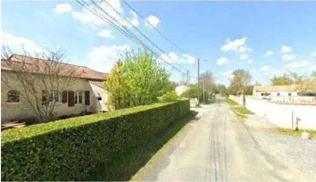
Latelier de meg street view et 360deg