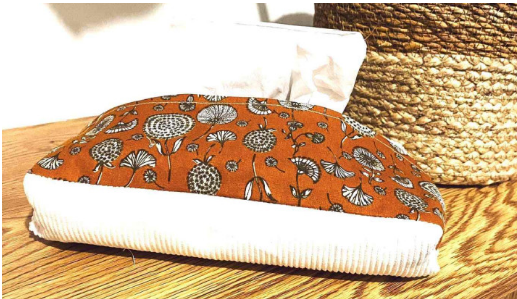
Latelier de meg tout