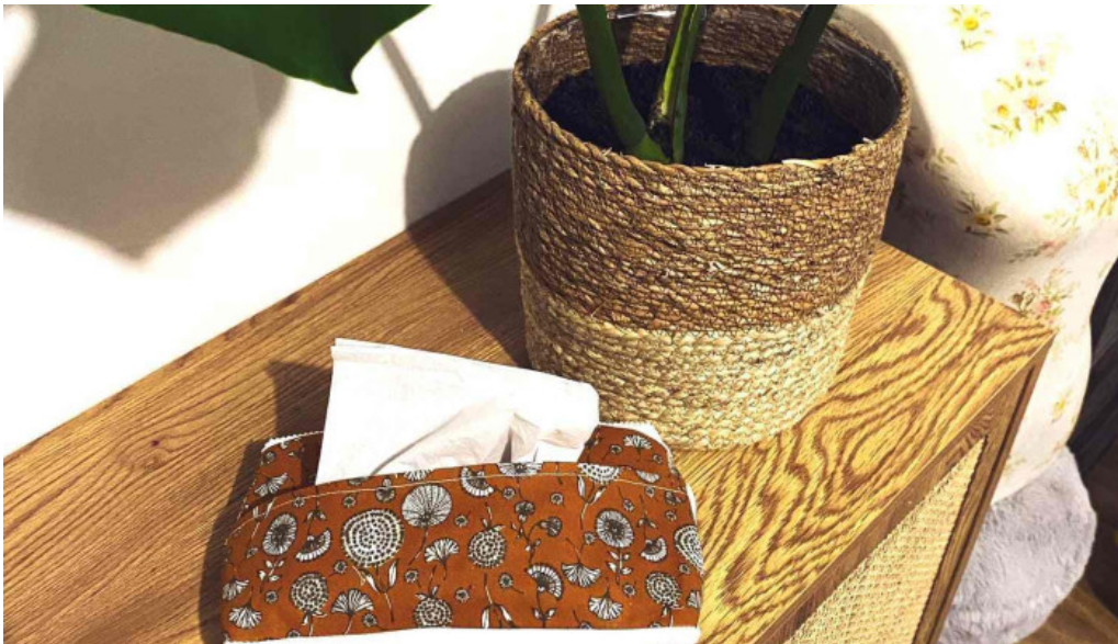
Latelier de meg photos du proprietaire