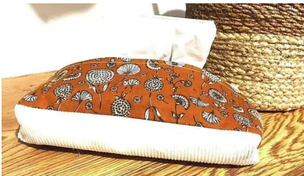
L atelier de meg aiffres