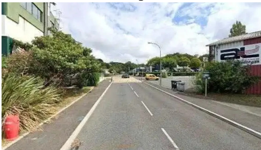
Kc menager tout