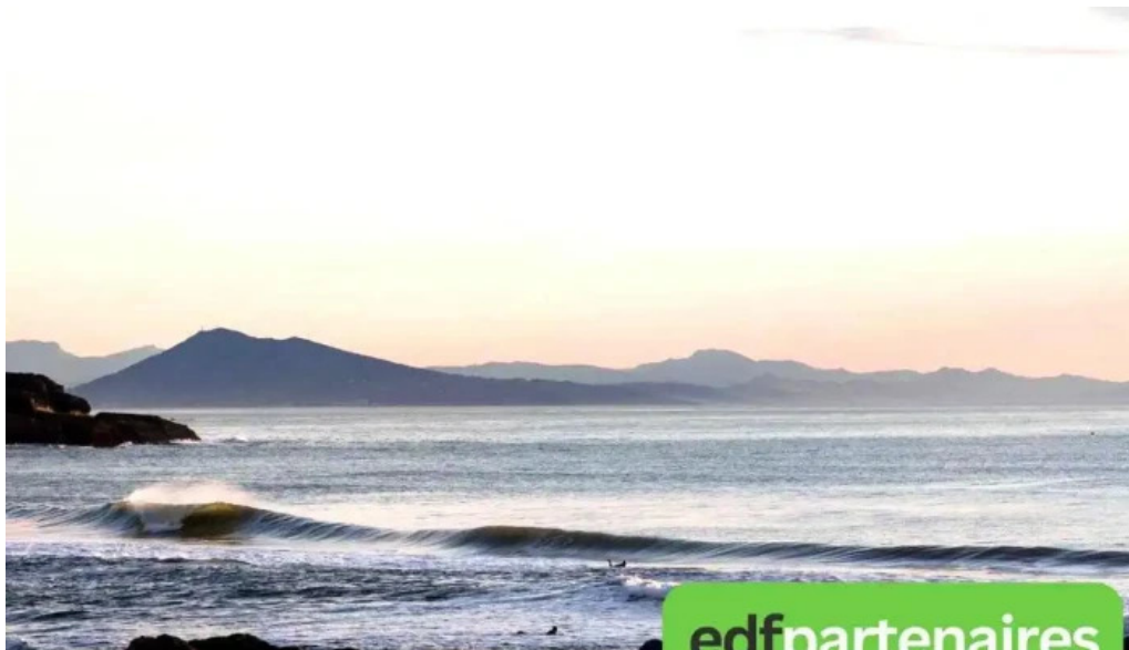
Comptoir du surf tout