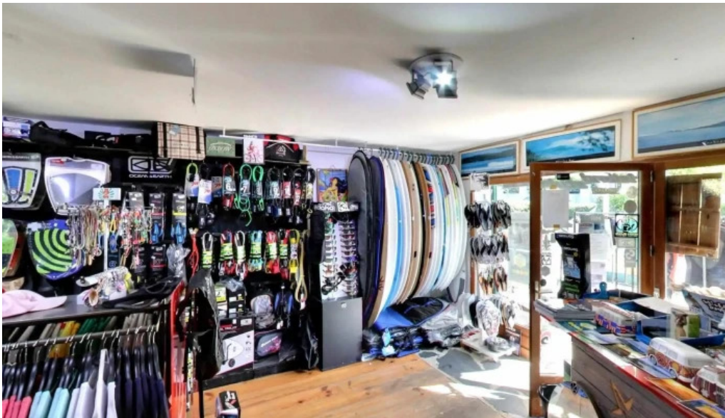
Prosurf surf shop bidart tout