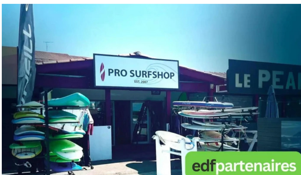
Prosurf surf shop bidart bidart