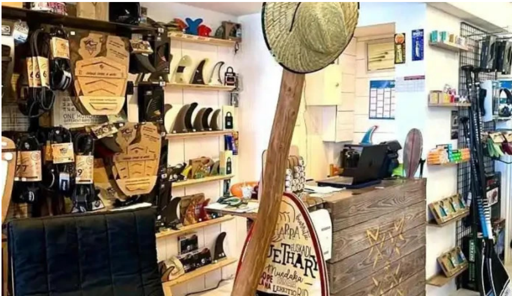
Prosurf surf shop bidart interieur