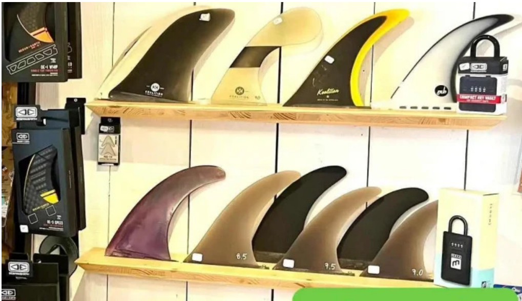
Prosurf surf shop bidart photos du proprietaire