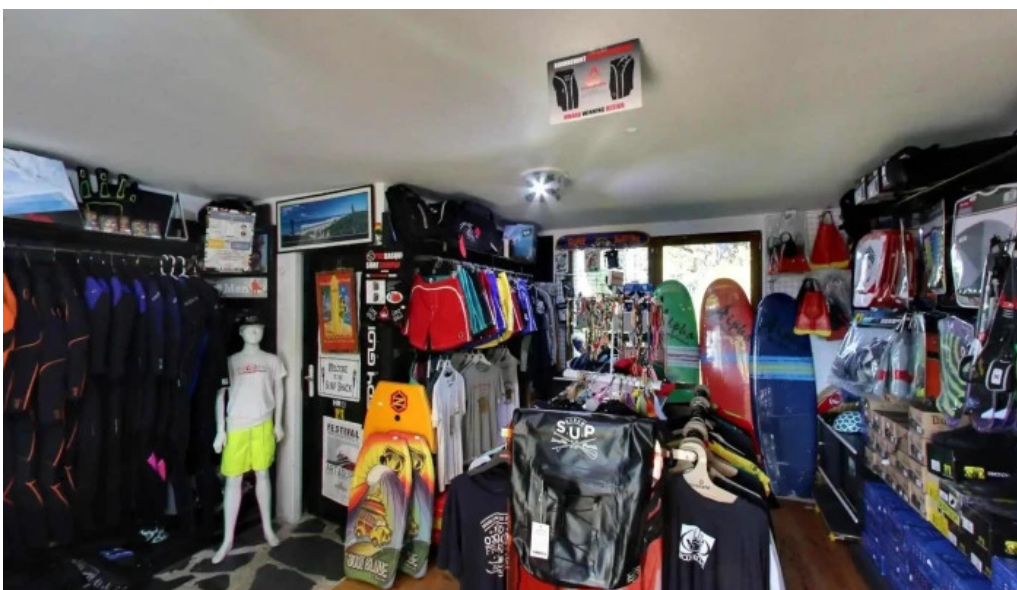
Prosurf surf shop bidart street view et 360deg